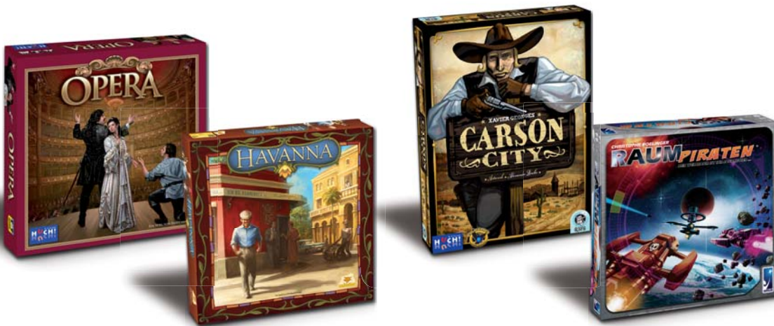
v. l. n. r.: Opera, Havanna, Carson City und Raumpiraten